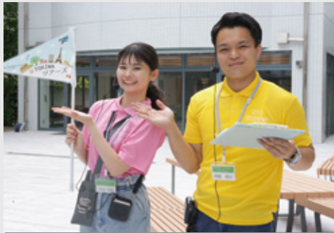
キャンパスツアー ～TOKIWAツアーズ～